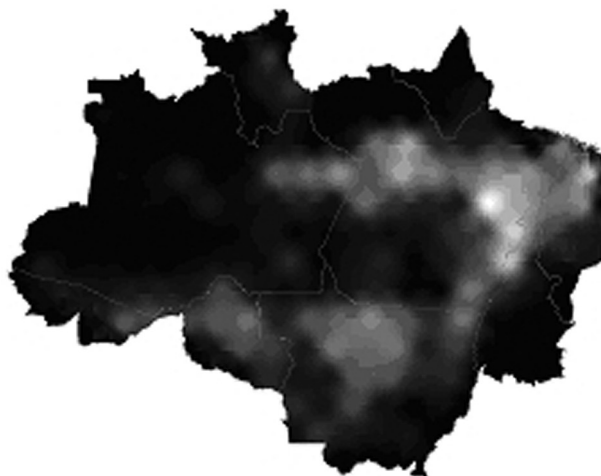
Figura 3 - Distribuição da estimativa de vegetação secundária na AML em km 2

A Figura 3 apresenta a distribuição espacial da vegetação secundária em termos de sua área (em km 2 ) na AML. Nesta figura é possível observar que uma grande área de ocorrência da vegetação secundária se dá na região do “arco do desflorestamento”, embora a proporção da vegetação secundária em relação a área desflorestada seja menor, como observado na figura 2. Isso se dá devido à maior extensão de área desflorestadas nessa região. Outra região que apresenta grande área de ocorrência de vegetação secundária é a calha do médio e baixo Amazonas. Esse padrão pode ser explicado devido ao tipo de ocupação da região por uma população ribeirinha, praticante de uma agricultura de subsistência e itinerante, que tem influência positiva na ocorrência de vegetação secundária (Perz e Skole, 2003; Martins, 2005).