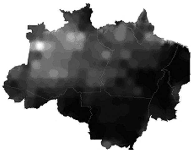
Figura 2 – Distribuição do IVSM na AML

cinza 255 foi associado ao maior valor de z. Assim na Figura 2 valores mais claros significam maiores IVSM e na Figura 3 valores mais claros significam maiores estimativa em km 2 de vegetação secundária