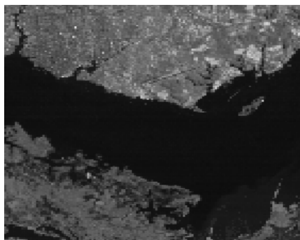
Figura 2 - Exemplo de dado de sensoriamento remoto (imagem LANDSAT de Manaus)