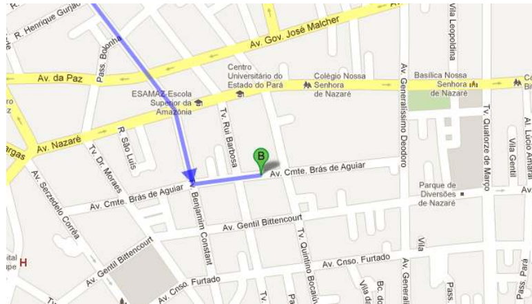
B- Belem Soft Hotel

Todas as reservas já feitas e hospedagem paga!